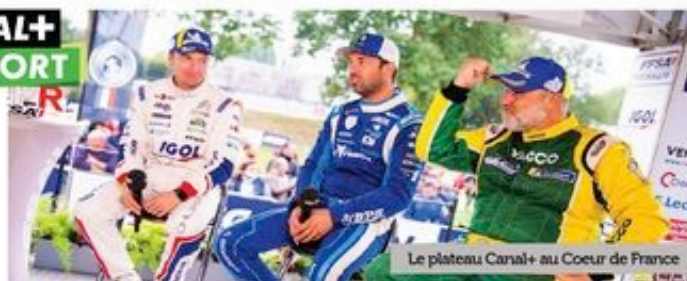
Le plateau Canal+ au Coeur de France