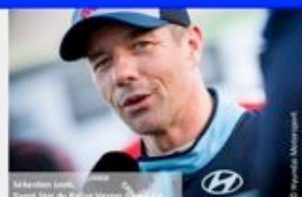
Sébastien Loeb, pilote Grand Star du Rallye Vosges Grand Est