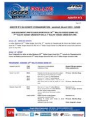
ADDITIF N° 1