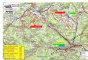
CARTE ÉTAPE 2