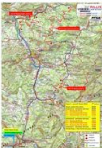
CARTE ÉTAPE 1