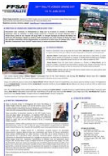
LETTRE DE PRÉSENTATION