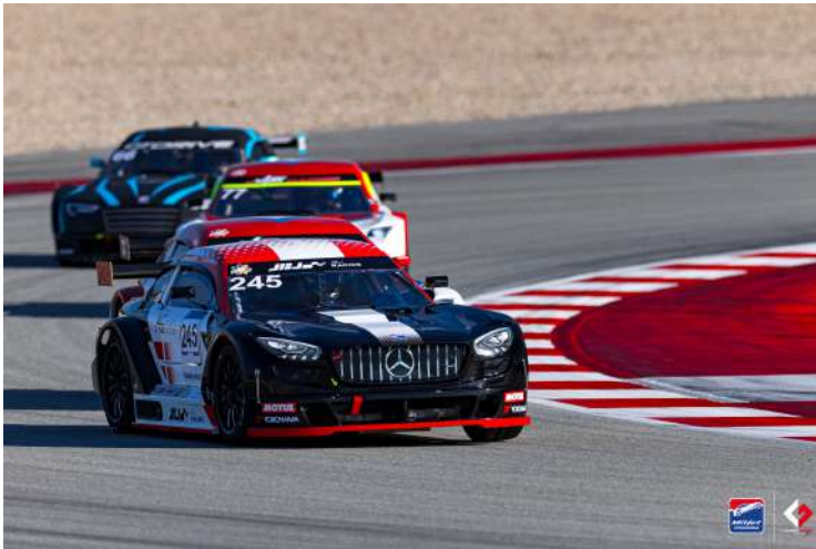
Povilas Jankavicius - Jesper Jensen / JBJ Racing

Cette course, marquée par la diversité des équipes en lice et l'énergie des pilotes, conclut une saison riche en émotions. Les Mitjet International Series confirment leur capacité à offrir des compétitions spectaculaires, où chaque seconde compte, et donnent rendez-vous en 2025 pour de nouvelles sensations fortes.