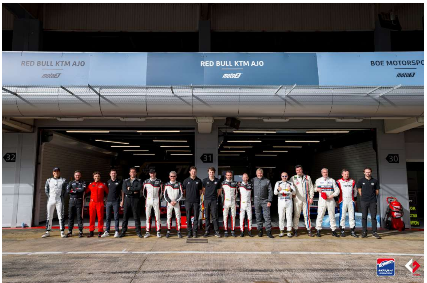
Le team VPS Racing