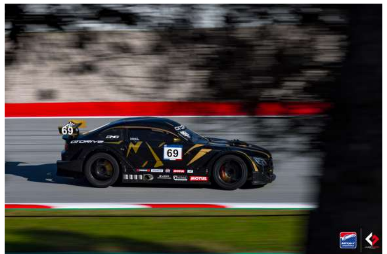
Xavier Boulard - Lorenzo Gatti / GTDrive Racing