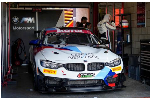
Une BMW M4 GT4 chasse l'autre...

Au passage, L'Espace Bienvenue tient sa moyenne d'un podium au moins par week-end et reprendra la quête du titre de champion de France à la rentrée, à Lédenon, les 10 et 11 septembre prochains.