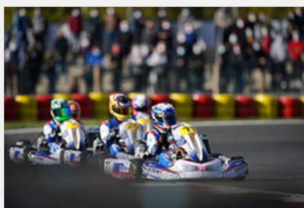
Superbe spectacle en Junior.

La 3 e épreuve du Championnat de France Junior a commencé fort par de beaux affrontements lors des phases qualificatives sous le beau temps de Laval. Le tracé mayennais et son nouveau revêtement offrent un cadre sélectif et valorisant à la compétition.