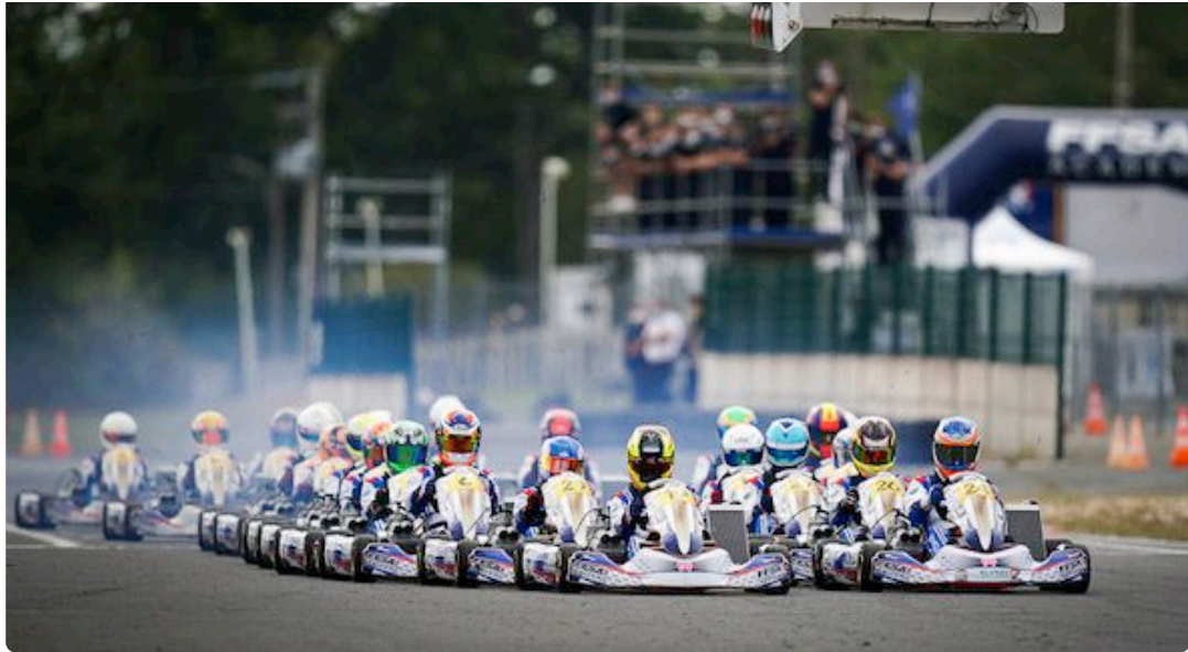
Championnat de France Junior FFSA Academy