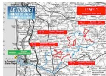
CARTE ETAPE 1