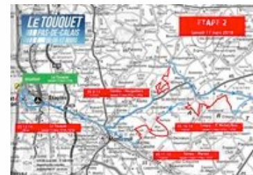
CARTE ETAPE 2